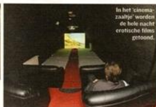
In het 'cinema-zaaltje' worden de hele nacht erotische films getoond.