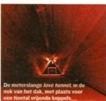
De meterslange love tunnel, in de nok van het dak, met plaats voor een tiental vrijende koppels.