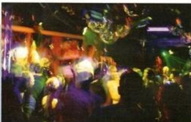
Acanthus is de grootste parenclub in de Benelux. Bezoekers kunnen op het gelijkvloers eten en dansen. Op de eerste verdieping zijn de liefdeskamers.