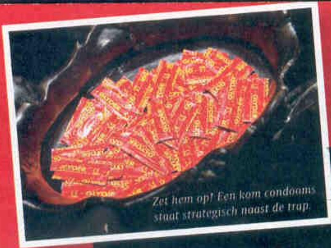
Zet hem op! Een kom condooms staat strategisch naast de trap.