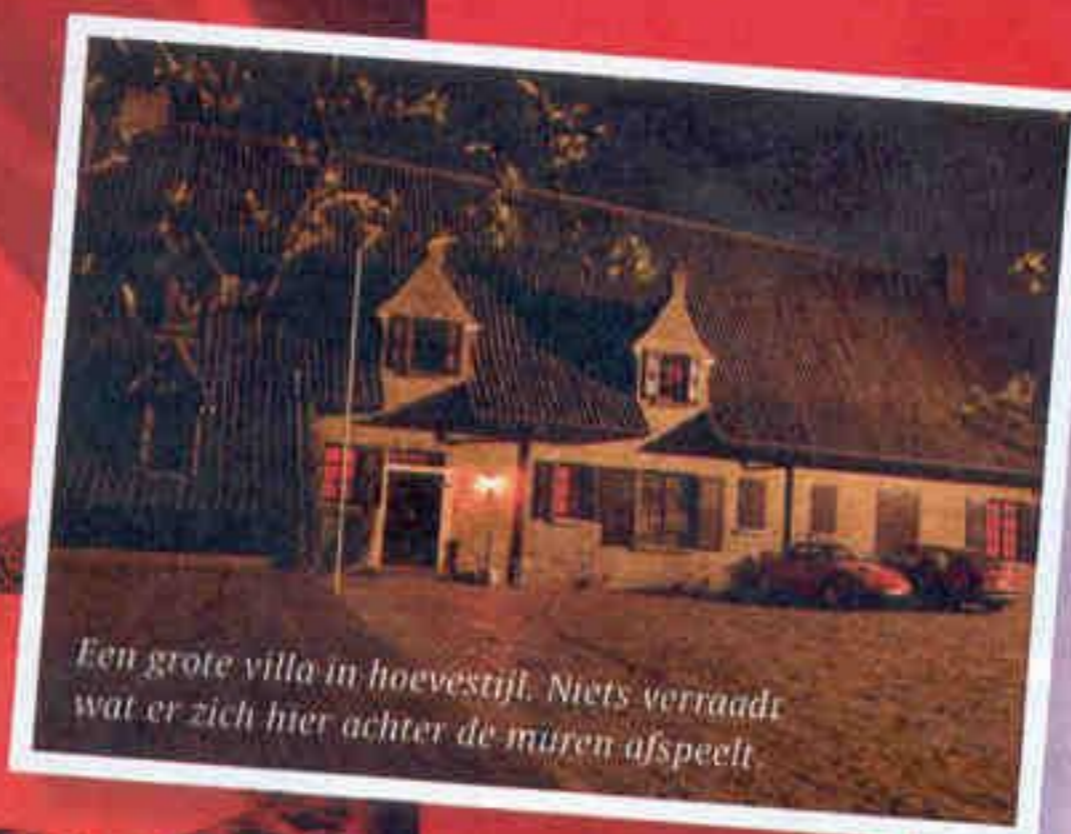
Een grote villa in hoevestijl. Niets verraaft wat er zich hier achter de muren afspeelt.