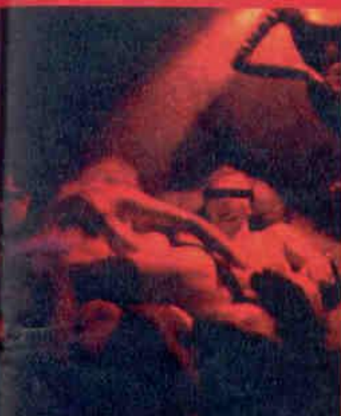
Tegen de ochtend liggen er ook in de discotheek mensen te krunkelen, zo hebben wij wat om naar te kijken terwijl we rustig een pintje drinken.