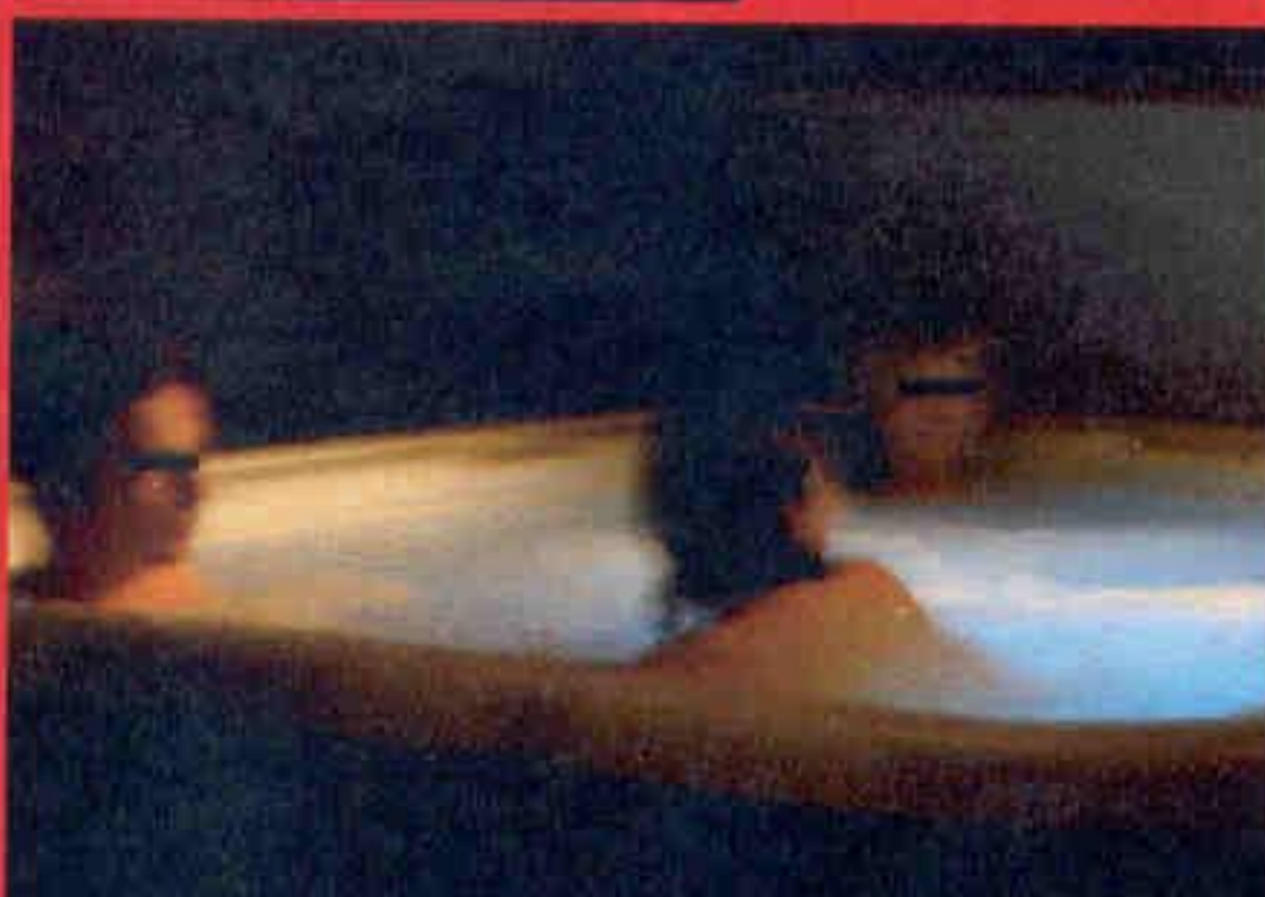
Seks is niet toegestaan in de jacuzzi, maar dat neemt niet weg dat het er heel heet kan worden.